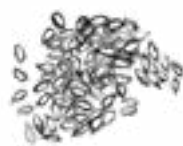
Brittiska kron linfrön