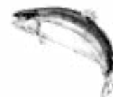
Lax från Skottland